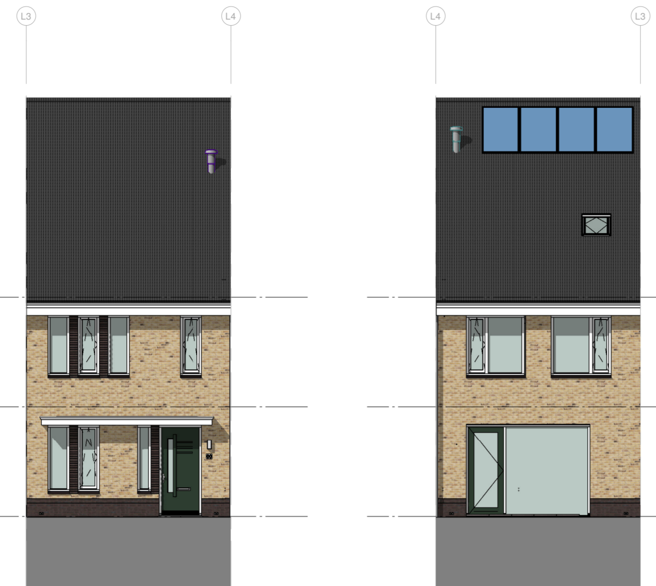
Voorgevel Schaal: 1 : 100